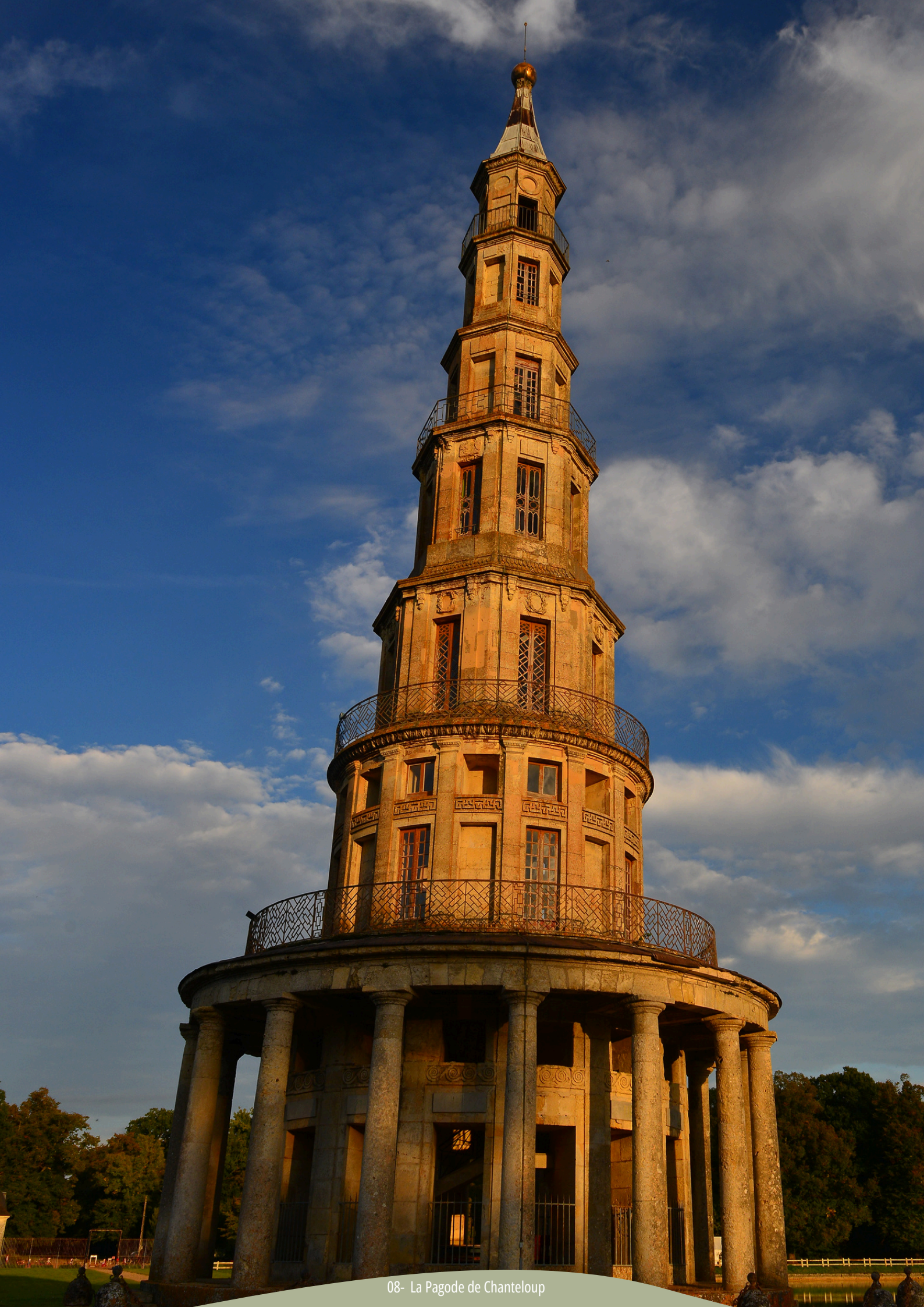
08- La Pagode de Chanteloup